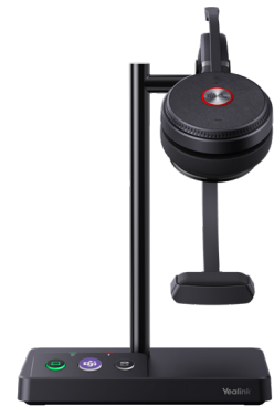
WH62 Mono Teams WH62 Mono UC