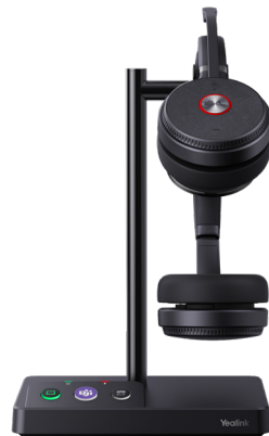
WH62 Dual Teams WH62 Dual UC